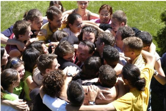
Toerustingsdag voor catecheten - Tieners motiveren en activeren